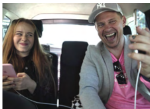
GIRL GANG Inédit en France

Comédie de Stefan Westerwelle pour les CM1, CM2, 6ème, 5ème