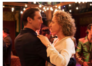
I'M YOUR MAN (ICH BIN DEIN MENSCH)

Film documentaire de Susanne Regina Meures à partir de la 4e