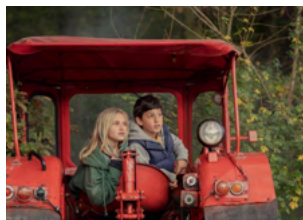
KANNAWONIWASEIN Inédit en France

Comédie de Stefan Westerwelle pour les CM1, CM2, 6ème, 5ème